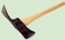
Kapak Dua Fungsi